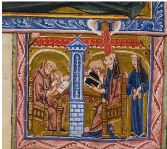
Hildegarde, Richardis et Volmar transcrivant les visions Livre des œuvres divines, 1 e vision (détail), Manuscrit de Lucques, 1230

Dans sa théologie, Hildegarde ne sépare jamais l'homme des lois de l'univers et de ses relations avec le vivant. Elle nous dit ainsi que, dans le mystère du salut, « tout est lié » pour reprendre le leitmotiv du Pape François dans l'encyclique Laudato Si .