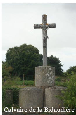
Calvaire de la Bidaudière

Les croix de nos calvaires s'offrent à nous comme des points de repère dans le paysage mais aussi pour notre vie de foi. Bien souvent, au pied de la croix est inscrite une petite phrase latine : « O Crux ave, spes unica ! » (O Croix notre unique espérance !). Pourquoi ? En quoi la croix est-elle un signe d'espérance ?