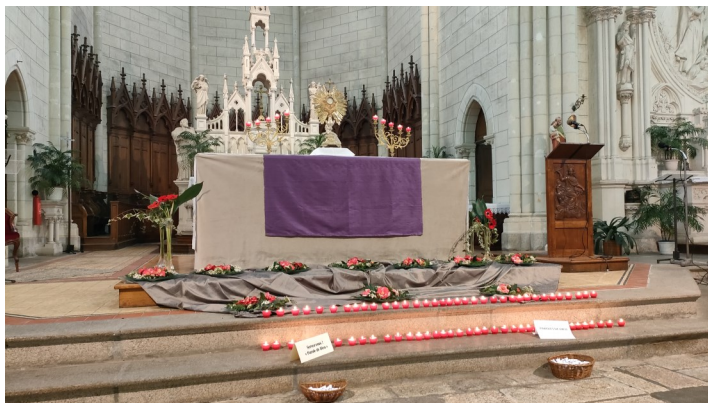
Journée du pardon Mercredi des Cendres