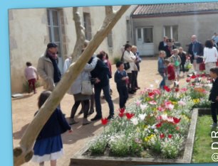
Pâques – Chasse aux oeufs après la messe