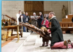
Vendredi Saint – Office de la passion