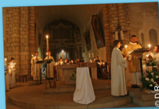
Samedi Saint – vigile pascale