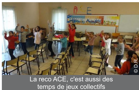
La reco ACE, c'est aussi des temps de jeux collectifs

ces trois mots, comment Il marche avec nous sur le chemin, notamment pendant ce carême qui nous mène vers la fête de sa résurrection et de la vie. Ce temps de réflexion et de prière s'est conclu par la prière de Saint François que les enfants ont rapportée chez eux.