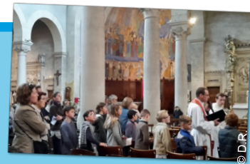
Vendredi Saint – Chemin de croix