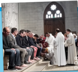
Jedi Saint – le lavement des pieds