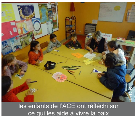
les enfants de l'ACE ont réfléchi sur ce qui les aide à vivre la paix

Les enfants étaient heureux de se revoir dans cet interclub ; ils se sont d'abord présentés : le nom du club, la paroisse, ainsi que les invités à la réco. A partir d'un texte du pape sur la Miséricorde, faisant relever trois mots : PAIX, JOIE et SERENITE, ils ont échangé en petits carrefours sur chacun des mots. Quels sont les moments où je vis ce mot ; ce qui m'aide à le vivre ? Quels sont les moments où je ne vis pas, où il m'est difficile de vivre le mot ? Quelles sont les personnes que j'aide ou qui m'aident à vivre ce mot ? Après ce temps d'échanges forts, simples et vrais en petits groupes, ils ont mis en commun leurs réflexions et témoignages devant les autres et ont complété le panneau collectif.