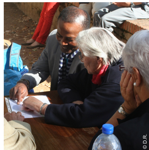
De février à juin, vivez 4 rencontres en équipe pour approfondir le mystère de l'Eucharistie et de la mission

Rappelons-nous la mission des équipes eucharistiques indiquée à leur création par notre curé, il y a 2 ans : « Le vrai projet des équipes eucharistiques, c'est de favoriser l'accueil fraternel de toute personne qui cherche Dieu. ». Chaque équipe était invitée à plonger dans la Parole de Dieu : lire les textes de la Bible, laisser pénétrer cette Parole au plus profond de son cœur, avec l'aide de l'Esprit Saint.