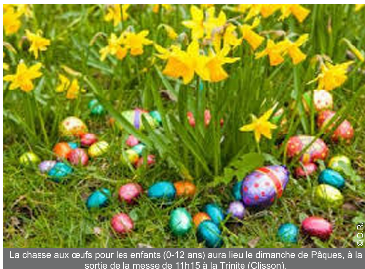
La chasse aux œufs pour les enfants (0-12 ans) aura lieu le dimanche de Pâques, à la sortie de la messe de 11h15 à la Trinité (Clisson).

« Tous les enfants sont invités à participer à une chasse aux œufs à Clisson, le dimanche de Pâques. »